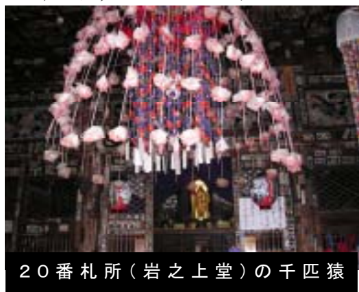
20番札所(岩之上堂)の千匹猿